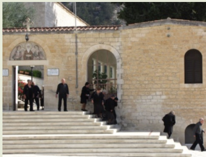
Klooster Aghios Neofytos.

Aangekomen op Schiphol bij het verzamelpunt kregen wij een bepaalde kleur sjaal om. Zo konden we heel snel zien bij wie we in het team zaten en konden we snel kennis maken met onze teamleden die we voorheen alleen nog maar bij naam kenden. Elk team had een naam van een figuur uit de Griekse mythologie.